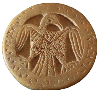
Figura 4. Anvers de la peça 1615-3.