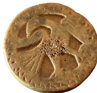
Figura 5. Revers de la peça 1615-3.