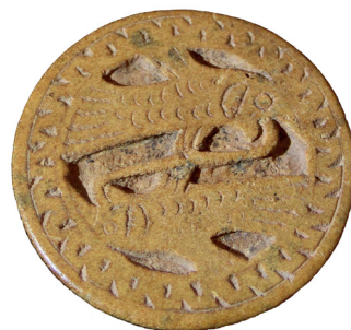
Figura 3. Revers de la peça 1615-1.