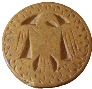
Figura 2. Anvers de la peça 1615-1.