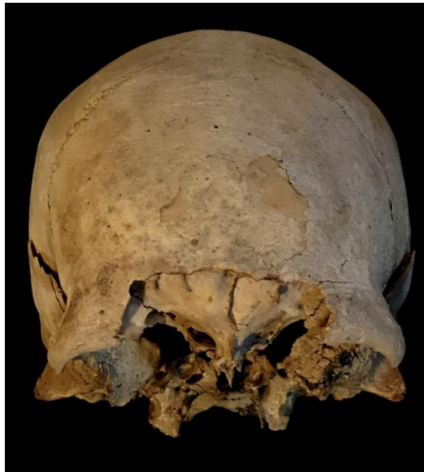
Figura 4: individu 2/1. Norma anterior