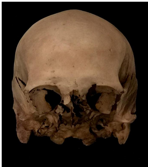
Figura 2: individu 1/1. Norma anterior